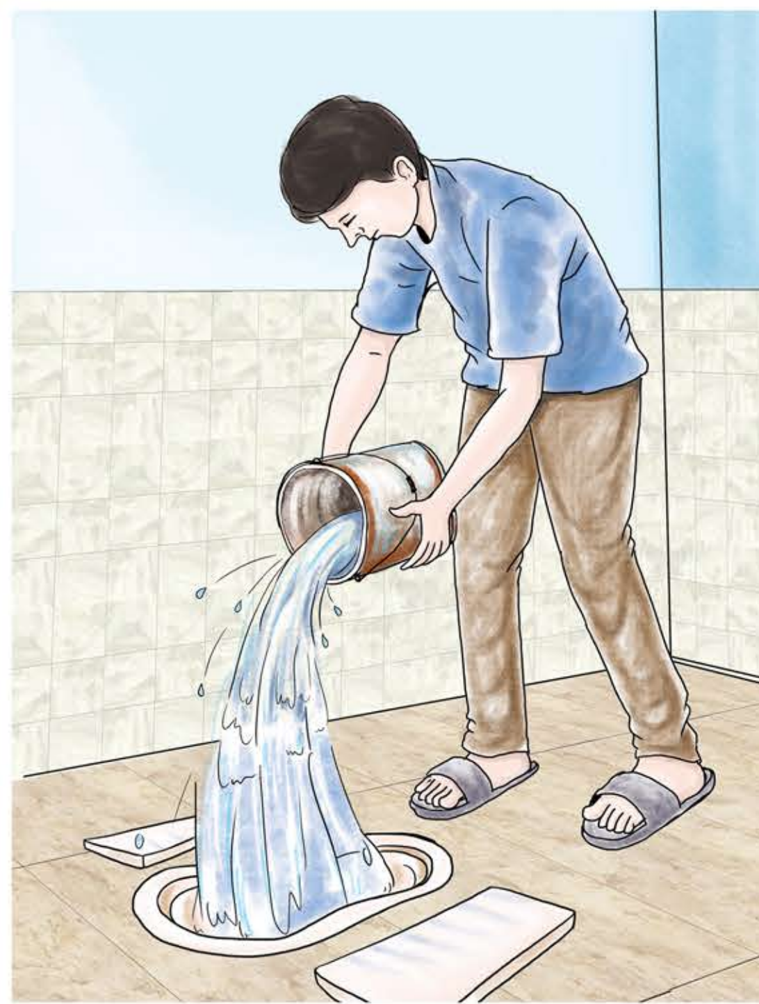
शौचालयको प्रयोग गरिसकेपछि अनिवार्य रूपमा पानी हाल्नुहोस् र धारा बन्द गर्नुहोस् ।