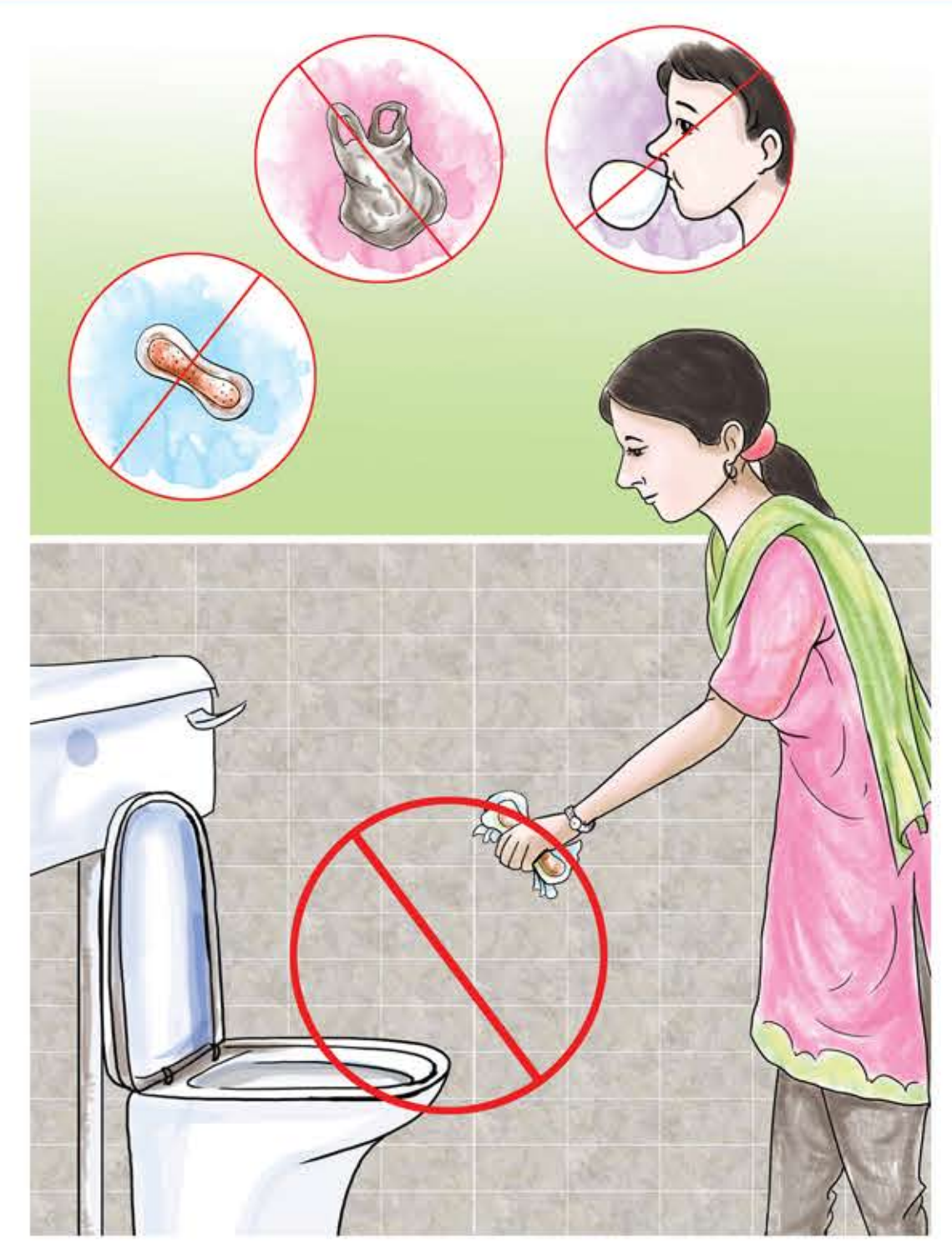
शौचालयमा प्याड, चुङ्गम, प्लाष्टिक र कागज जस्ता चीजबीज नफर्चाउनुहोस् ।