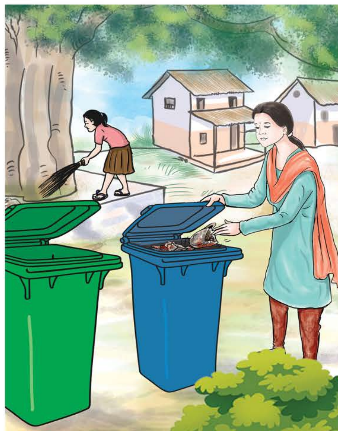
फोहोरलाई डस्टबिनमा मात्र फाल्ने गर्नुहोस् ।