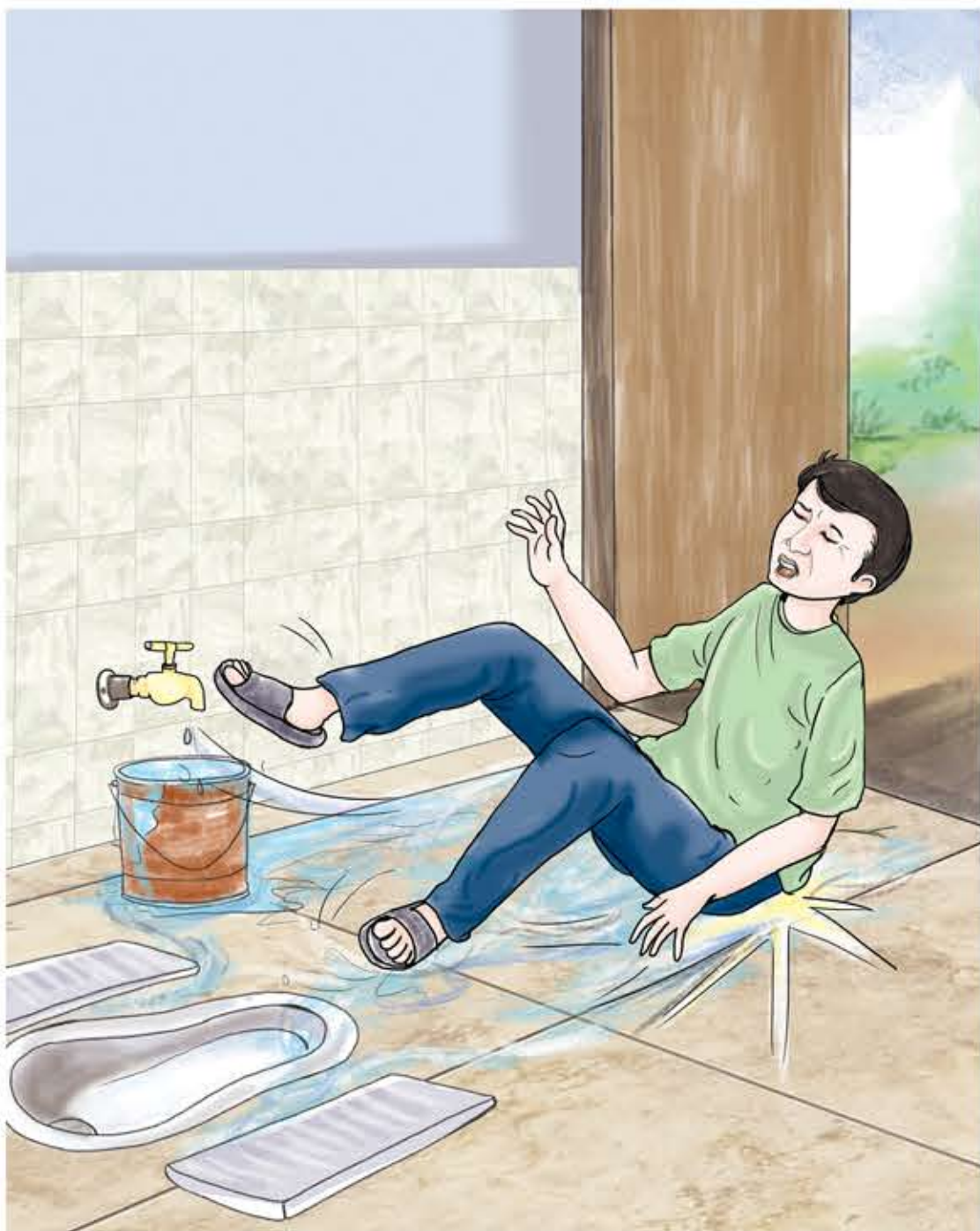
शौचालयमा जथाभावी पानी नपोख्नुहोस्, भुँईँ चिप्लो भएमा साथीभाईहरू लड्न सक्छन् ।