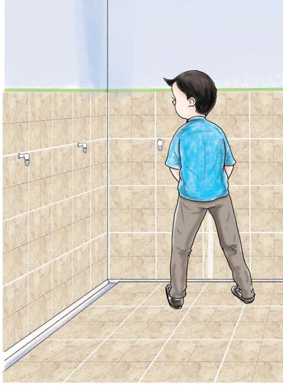
पिसाब गर्दा शौचालयको प्यान वा नालीमा मात्र पर्ने गरी गर्नुहोस् ।