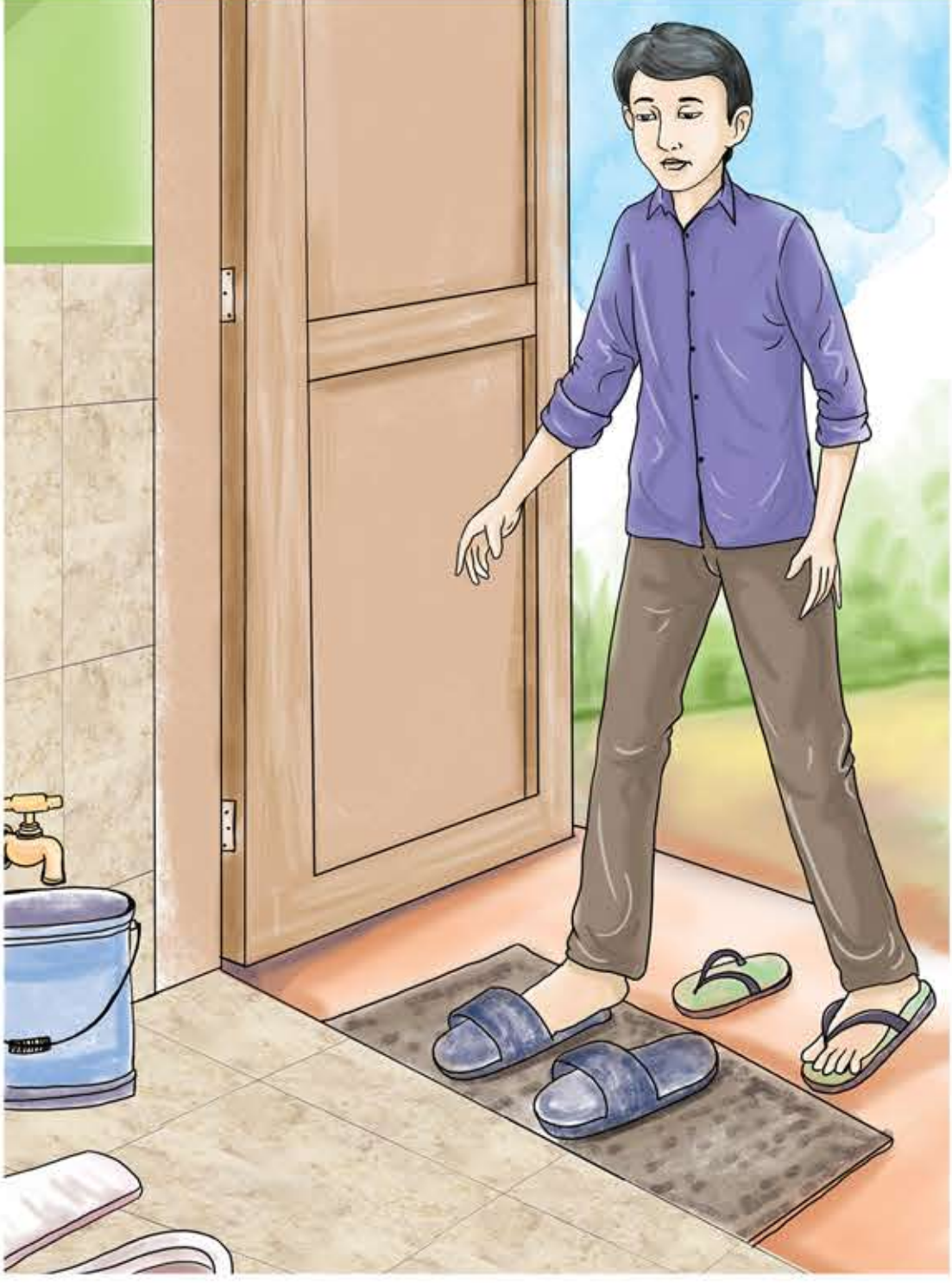
शौचालयको लागि छुट्टै चप्पल राख्नुहोस् र शौचालय जाँदा त्यही चप्पल मात्र प्रयोग गर्नुहोस्