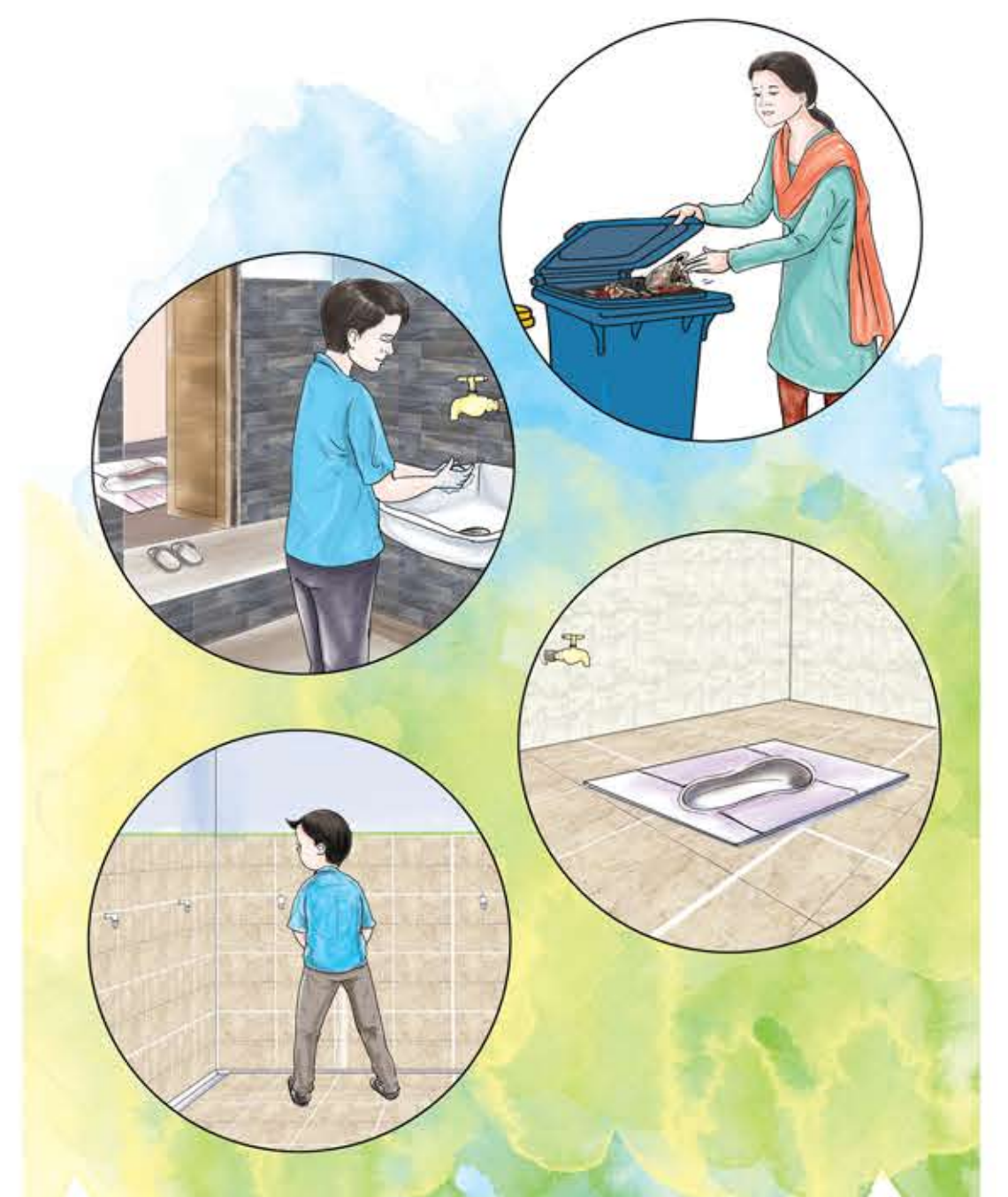
शौचालय र शौचालयमा भएका सामग्रीहरूको सही सदुपयोग र सुरक्षा गर्नुहोस् ।